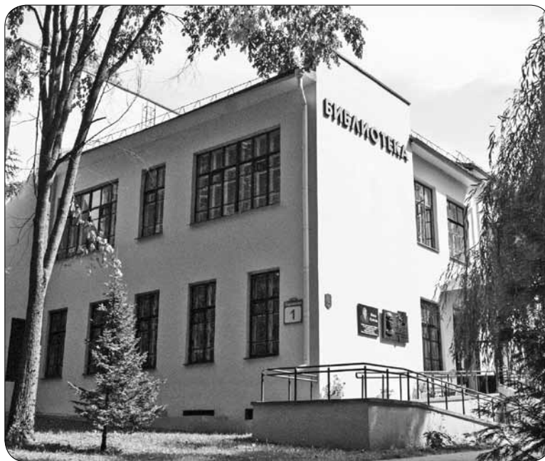
Беспроводной интернет исправно работает не только в здании академической библиотеки, но и вокруг него.

– В хорошую погоду не обязательно сидеть в четырех стенах. Можно расположиться на лавочках возле нашей библиотеки и, зная пароль, посидеть в