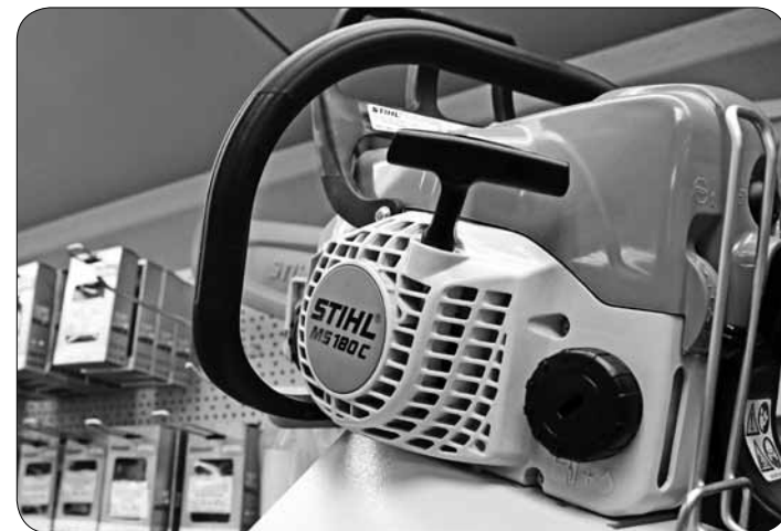
В данный момент в фирменном магазине проходит осенняя акция STIHL, которая продлится до 20 ноября.

В акции участвуют владельцы всех моделей бензодвигательных пил STIHL, когда-либо проданных в Беларуси. Все, что нужно сделать – это взять свою пилу и отнести ее в наш авторизованный сервисный центр. В рамках этой программы вам квалифицированно и бесплатно заточат