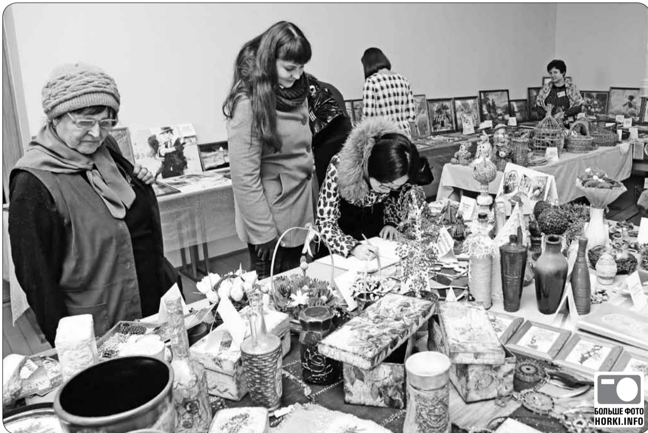
Народные умельцы показали таланты в самых различных направлениях: вышивка, лоскутная аппликация, бисероплетение, вязание, изделия из соломки и лозы, скрапбукинг, канзаши, торцевание и многое другое.

Во время подведения итогов было предложено продлить выставку на пару недель и перенести ее в ДК БГСХА, чтобы большее число посетителей имело возможность познакомиться с талантливыми работами наших мастеров. ■