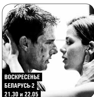
ВОСКРЕСЕНЬЕ БЕЛАРУСЬ-2 21.30 и 22.05

МИССИЯ: НЕВЫПОЛНИМА 3 *** Суперагент Итан Хант решил расстаться с оперативной работой и заняться подготовкой курсантов. Он даже решил жениться на привлекательной, ни о чём не ведающей Джулии. Руководство ЦРУ просит его принять участие в последней операции: спасении его бывшей ученицы Линдси Феррис из лап торговца оружием Оузана Дзвиана.