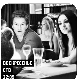
ВОСКРЕСЕНЬЕ СТВ 22.05

МИССИЯ: НЕВЫПОЛНИМА 3 *** Суперагент Итан Хант решил расстаться с оперативной работой и заняться подготовкой курсантов. Он даже решил жениться на привлекательной, ни о чём не ведающей Джулии. Руководство ЦРУ просит его принять участие в последней операции: спасении его бывшей ученицы Линдси Феррис из лап торговца оружием Оузана Дзвиана.