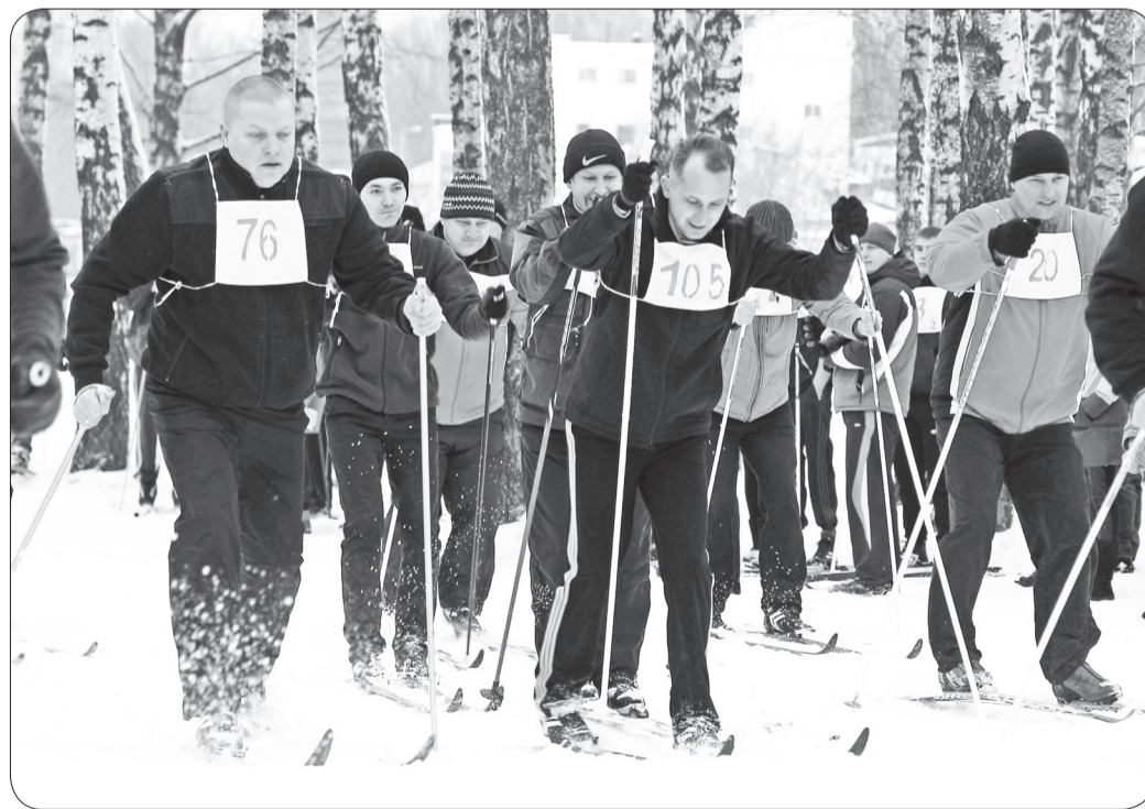
В субботу 28 января на Верхнем озере в Горках прошли спортивные соревнования "Горецкая лыжня-2017".