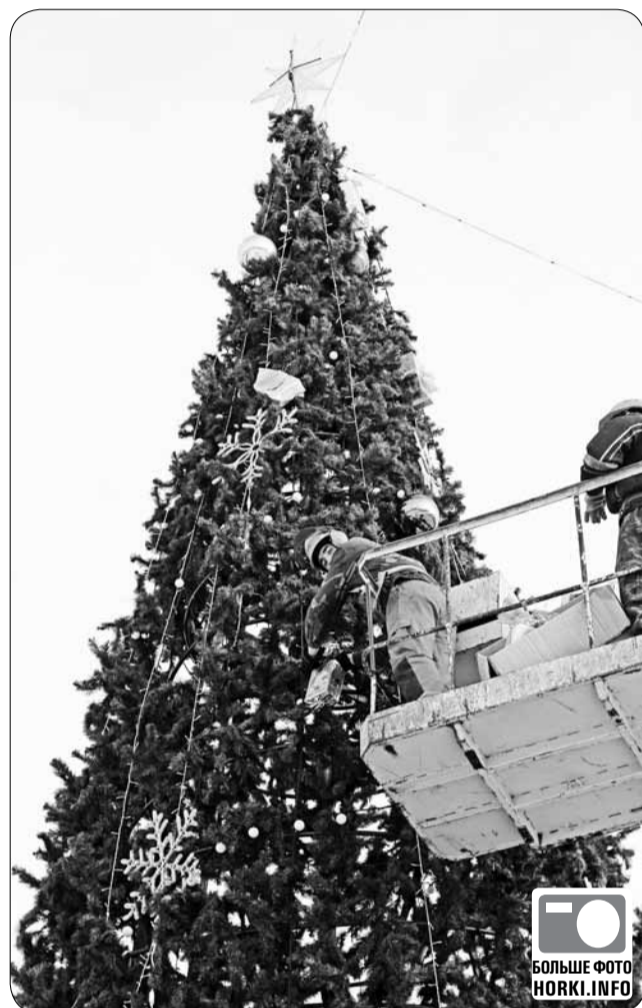
БОЛЬШЕ ФОТО HORKI.INFO