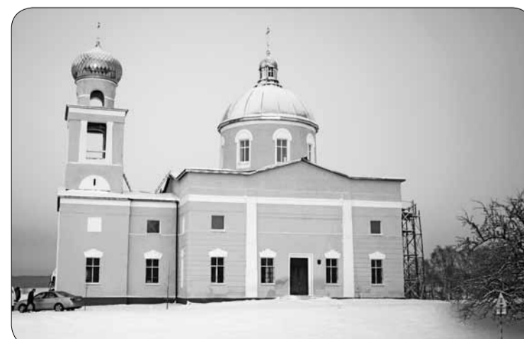
У права-слаўнай царкве Ушэцы (па-руску: Вознесения) у вёсцы Мазалава Мстислаўскага раёна працягваецца аднаўленне і абнаўленне. Вось як зараз выглядае гэты гістарычны будынак.