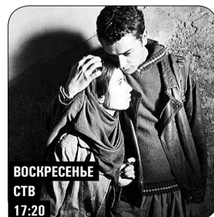
ВОСКРЕСЕНЬЕ СТВ 17:20