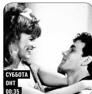
СУББОТА ОНТ 00:35