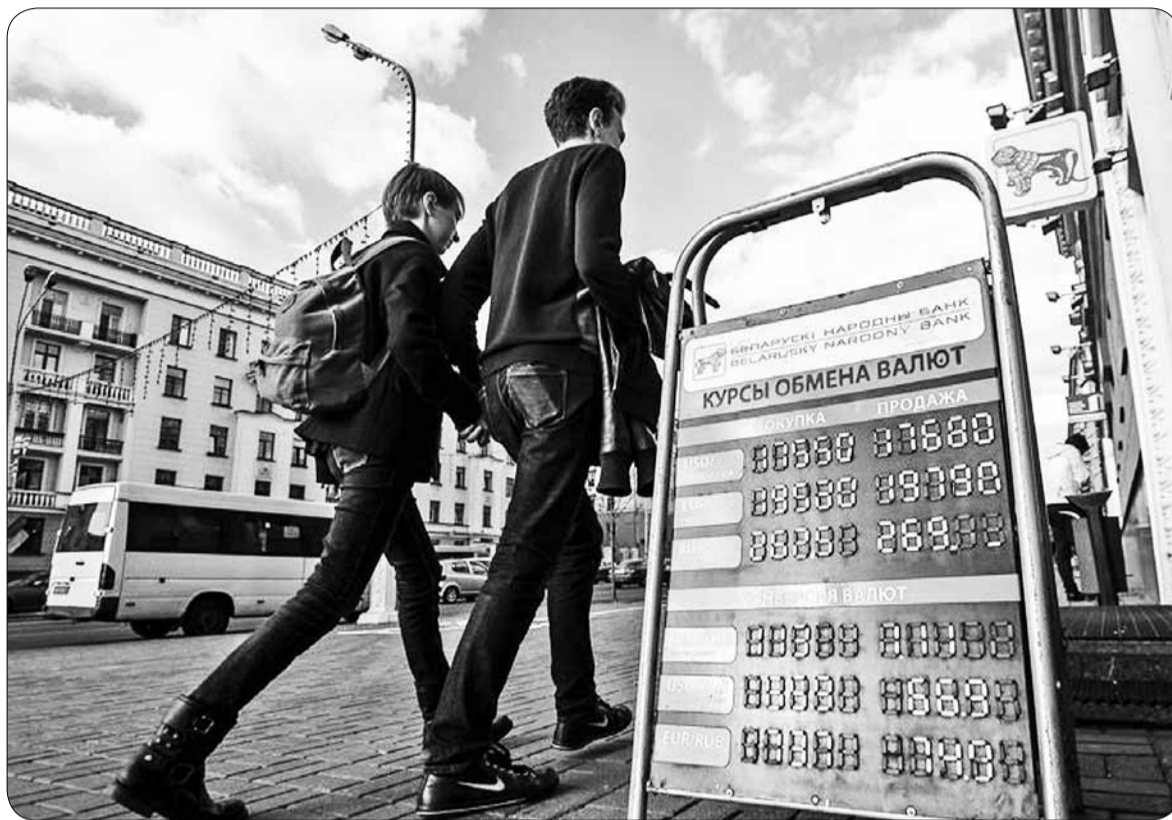
Цяжка паверыць, але 1 кастрычніка 2010 года па афіцыйным курсе адзін даляр каштаваў 3 010 рублёў.

За 2010–2014 ВУП вырас на 10%, а сёлета нават стаў адмоўным (прагноз дае каля мінус 2,8% за год). Пад ціскам фінансістаў прамыславікі вымушаны адступіць. За прыгожымі