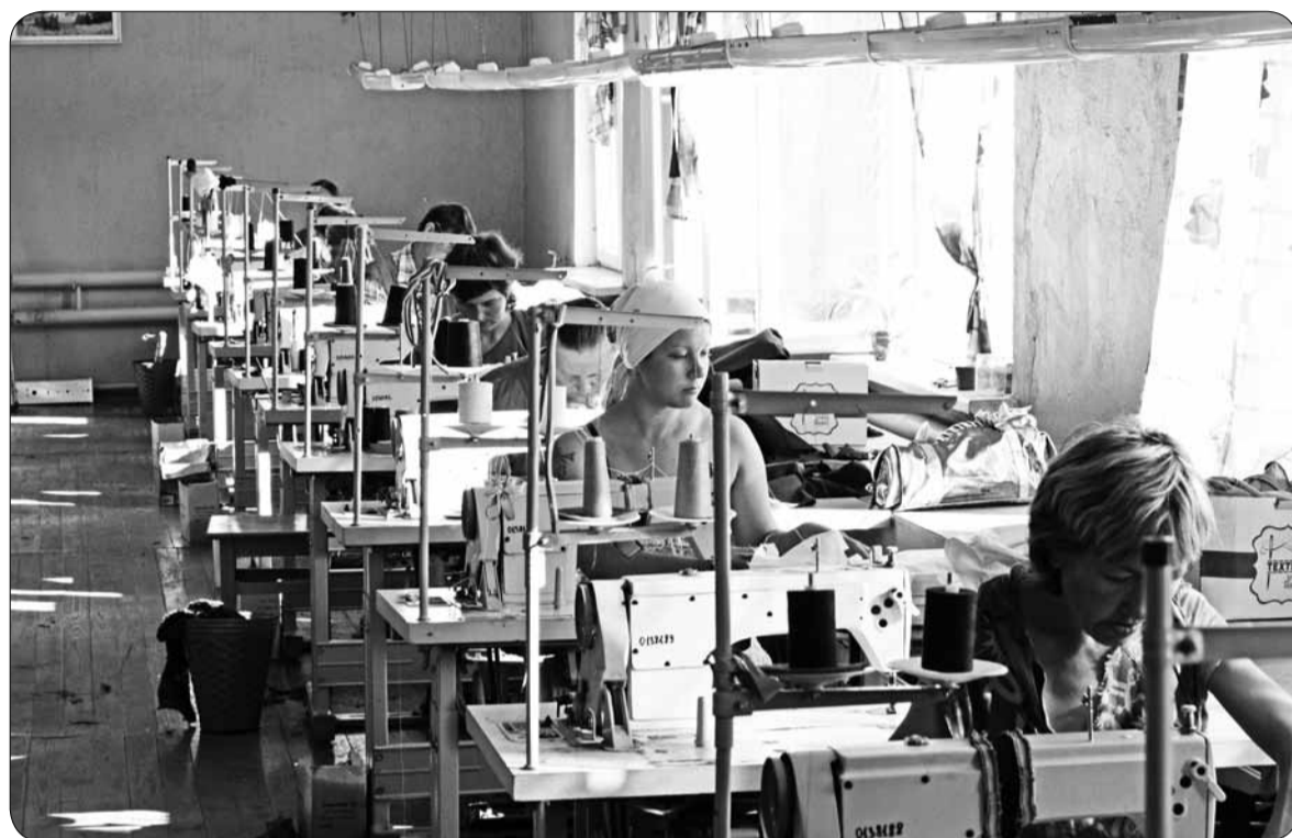
В ЛТП женщины проходят трудотерапию и зарабатывают средства, чтобы погасить задолженность по исполнительным листам. Так работа идет в швейном цеху.

– Если отвечать кратко: проходят трудотерапию. Зарабатывают деньги на погашение задолженности по исполнительным