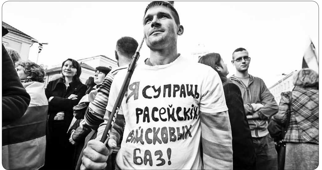
До 500 человек собрались на площади Свободы в Минске на организованной оппозицией акции против размещения российской авиабазы в Беларуси. Организаторы встречи считают, что размещение на белорусской территории российских военных объектов противоречит Конституции, угрожает независимости Беларуси и втягивает страну в военное противостояние с европейскими соседями.

По итогам проверки прокуратурой Могилевской области в Могилевский горисполком внесено представление об устранении нарушений земельного и природоохранного законодательства, причин и условий, им способствующих. ■