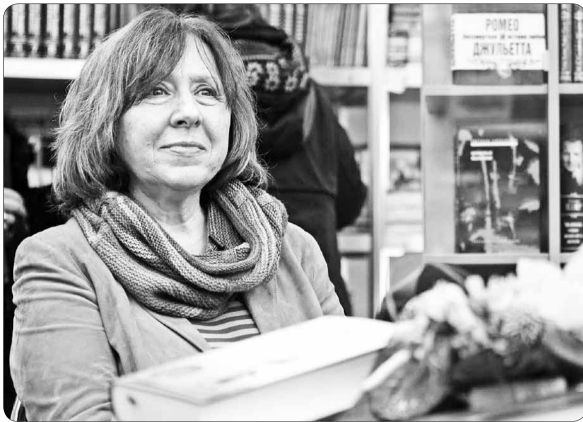
"У меня три дома – моя белорусская земля, родина моего отца, где я прожила всю жизнь, Украина, родина моей мамы, где я родилась, и великая русская культура, без которой я себя не представляю. Они мне все дороги. Но трудно в наше время говорить о любви", – Светлана Алексиевич.

Всего за девять месяцев этого года в Беларуси было произведено 19,1 тысячи телевизоров. В прошлом году их было сделано в 4,2 раза больше. Производители сейчас отмечают снижение спроса на их продукцию как на внутреннем, так и на внешнем рынках.