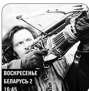
ВОСКРЕСЕНЬЕ БЕЛАРУСЬ-2 16:45

Магазин "Топаз" сдает в аренду ТОРГОВОЕ ОТАПЛИВАЕМОЕ ПОМЕЩЕНИЕ 40 СМ 2 Обращаться по телефону velcom: +375291599984