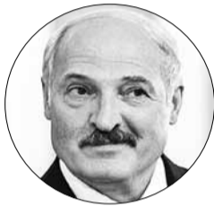
АЛЕКСАНДР ЛУКАШЕНКО 1 753 380

дидатов до 10 сентября. На следующий после этого день стартует предвыборная агитация. День голосования – 11 октября. ■