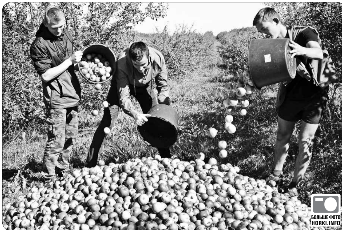
Горечкие школьники убирали яблоки в РУП "Учхоз БГСХА" на позитиве.

Свіней станет больш. До конца года во всех областях Беларуси появится как минимум по одному свиноводческому комплексу. Снижение поголовья этих животных произошло из-за распространения в Беларуси африканской чумы свиней. Борьба властей с эпидемией привела к значительному сокращению поголовья скота во второй половине 2013 года. А цены на внутреннем рынке на мясо значительно выросли.