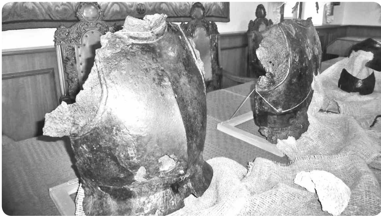
Мсціслаўская Віхра не аддала яшчэ ўсіх таямніцаў.

"Адзін з самых шыкоўных шлемаў быў выцягнуты звычайнай сеткай для лоўлі рыбы яшчэ ў 19 стагоддзі. Ён цяпер з'яўляецца аздабай гістарычнага музея ў