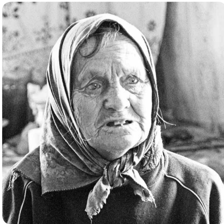
"Всю жизнь работали, а теперь никому не нужны".

Свернув в указанном направлении, едем по поросшей травой автомобильной колее. Неожиданно перед машиной выскакивает на дорогу с десяток маленьких серых перепелок. Мы едем тише, любуемся, а они бегут, бегут перед машиной, не догадываясь свернуть в сторону и уступить куску железа. Солнце окрашивает их неяркий наряд, делая его пестрым со множеством оттенков серого и коричневого. Наконец одна птичка – покрупнее и побойчее, свернула на обочину.