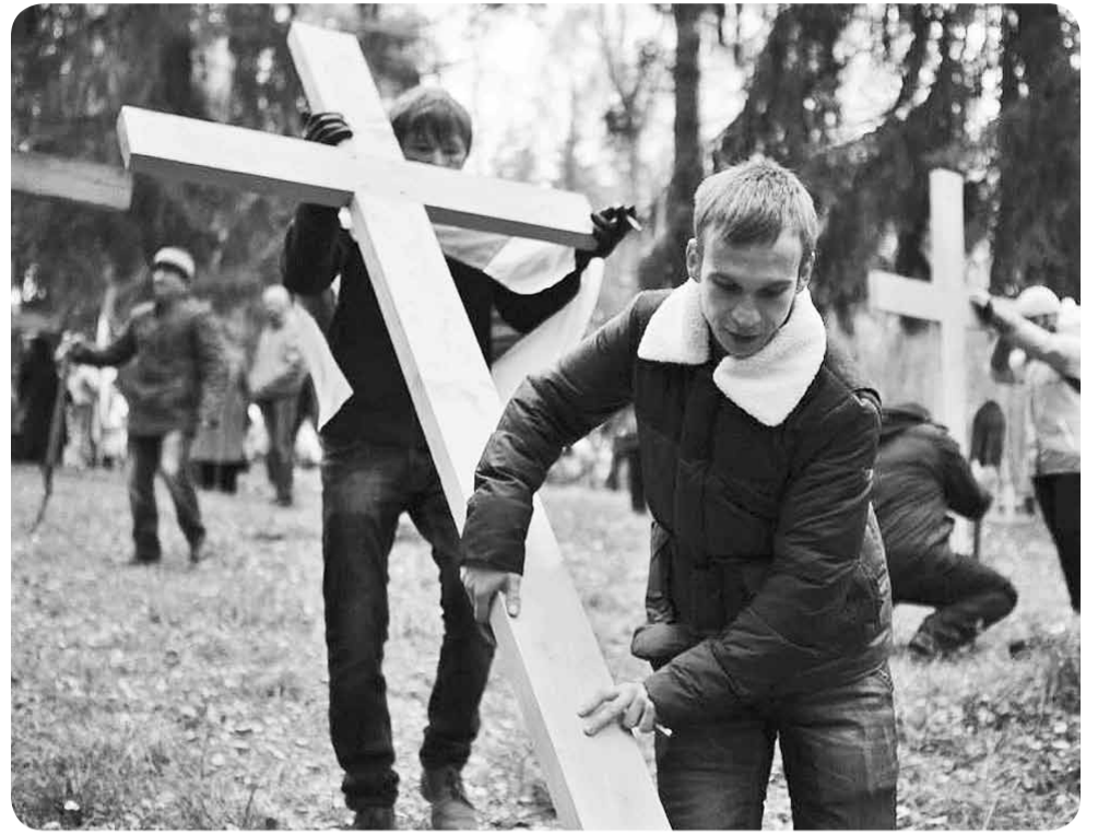
В Минске 2 ноября прошла акция поминовения предков "Дзяды". Ее участники установили в Куропатах новые кресты в память о жертвах сталинских репрессий.

СЛУШАЛИ: Дело Муравина Григория Моисеевича, гражданина Горок Могилев-