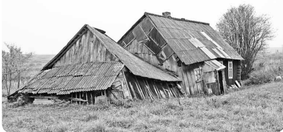
Бабушка Аня живет в этом домике одна.