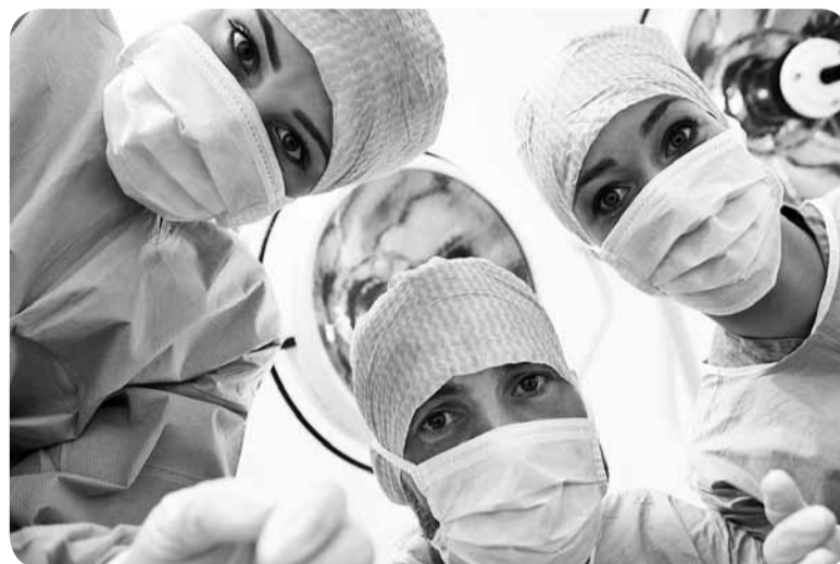
“Если ты хороший доктор, то у тебя будет 60 человек. У плохого – 40. А зарплата одинаковая”.

– Ну как?! Более качественные исследования!