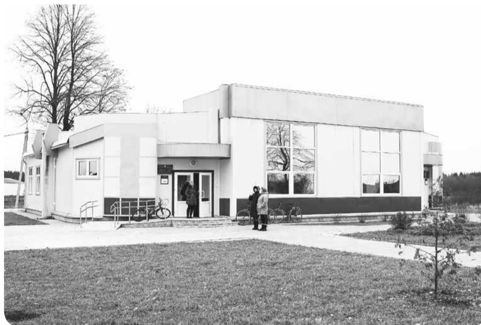
Часть этого нового современного клуба в Рудковщине местная молодежь может потерять.

В Рудковщине часть нового любимого местными жителями клуба чиновники хотят занять под сельский совет. Люди с такими планами категорически не согласны.