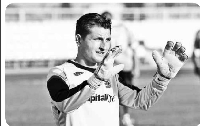
Фотографии Александра Храмова с матча смотрите на сайте horki.info .

В минувшую субботу 12 июля на городском стадионе в Горках в рамках областного турнира сразились две местные футбольные команды.