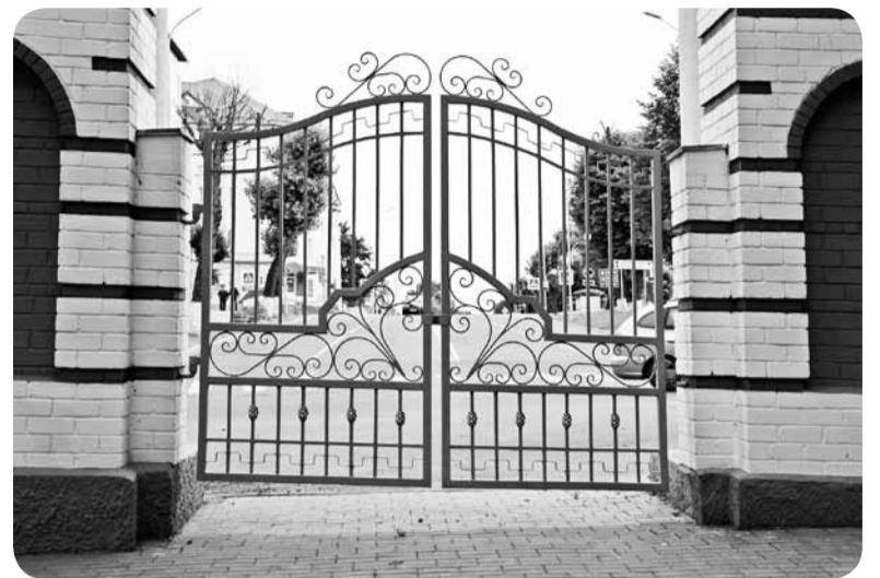
Чаму ў Горках лічаць, што гэтыя вароты круцяцца?

Наш зямляк пісьменнік Леў Разгон у кнізе "Позавчера і сёння" пісаў пра гэту частку горада так: "Внизу, у самой Поросіцы, на ёй вязкіх ілістых берагах прымостілось множаство домов, не пытавшихся даже сгруппироваться в подобие улиц. Это место называлось Глинище. Жила здесь самая отчаянная городская бед-