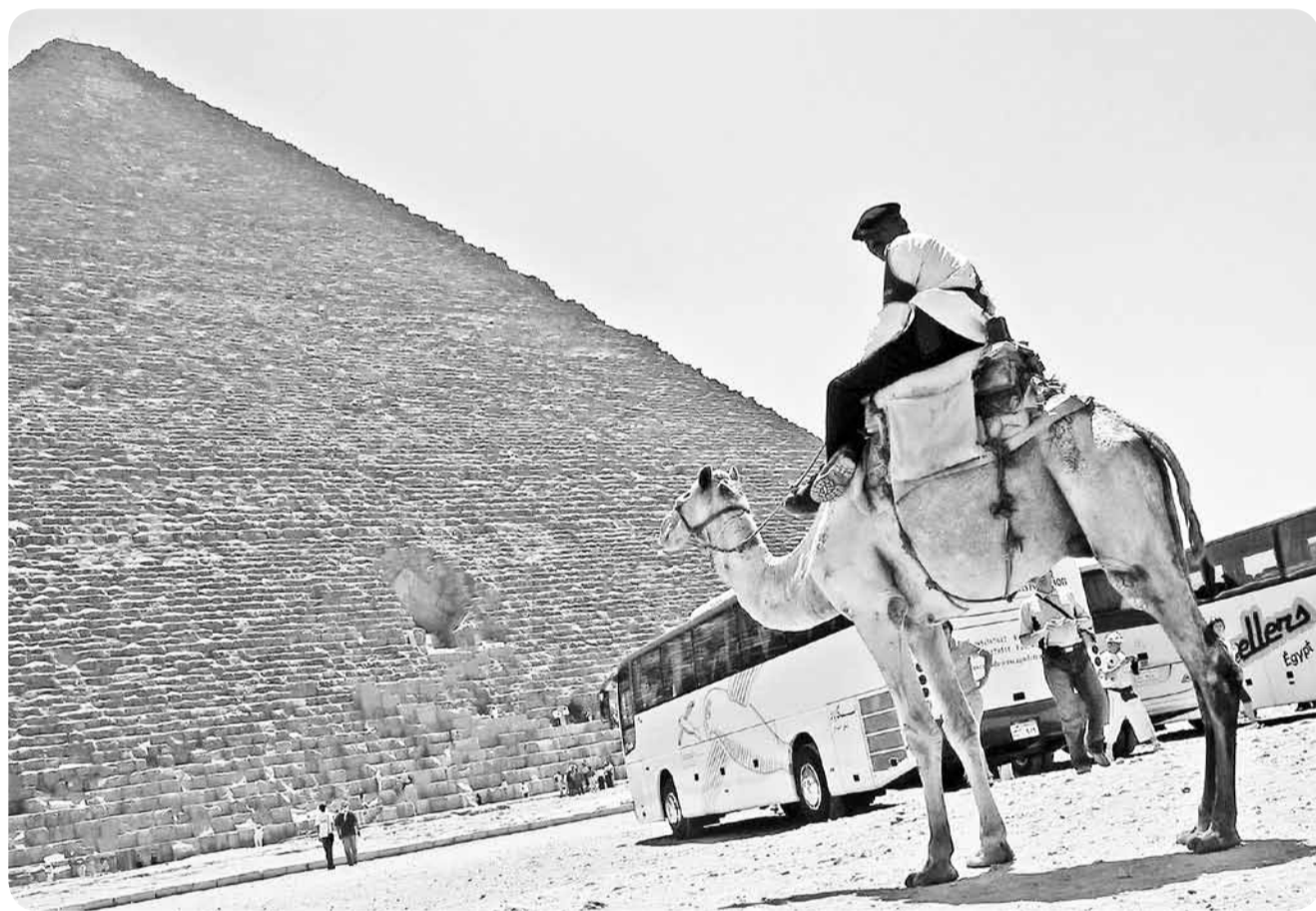
В Египет жители Горок круглый год едут с удовольствием.

В этом году мы открыли и предлагаем нашим отпускникам новое направление для отдыха – Краснодарский край, курортный город Геленджик. Несмотря на то что направление действует у нас первый год, желающих съездить уже очень много. Мы даже не всех можем принять – спрос пока