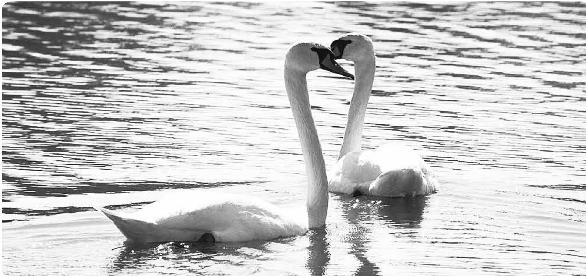
Лебеди. Озеро поселка Ленино Горецкого района и окрестности. Большой фоторепортаж смотрите на сайте horki.info .