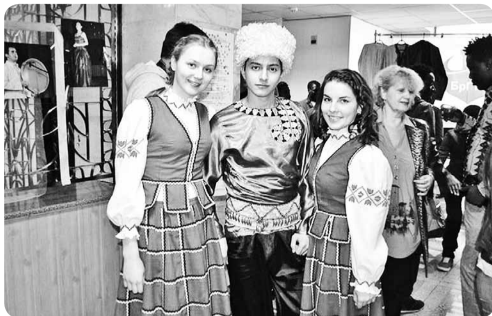
Подобное мероприятие впервые проводилось не только в Горках, но и в нашей стране.

Во Дворце культуры БГСХА прошла фотовыставка "100 лиц – молодежь в истории и культуре", выставка-презентация национальных культур "Орнаменты стран в орнаменте мира".