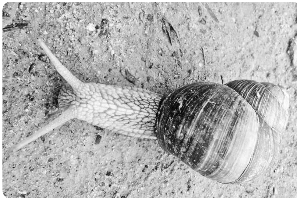
Такую улитку размером ладонь я встретила по дороге на работу.