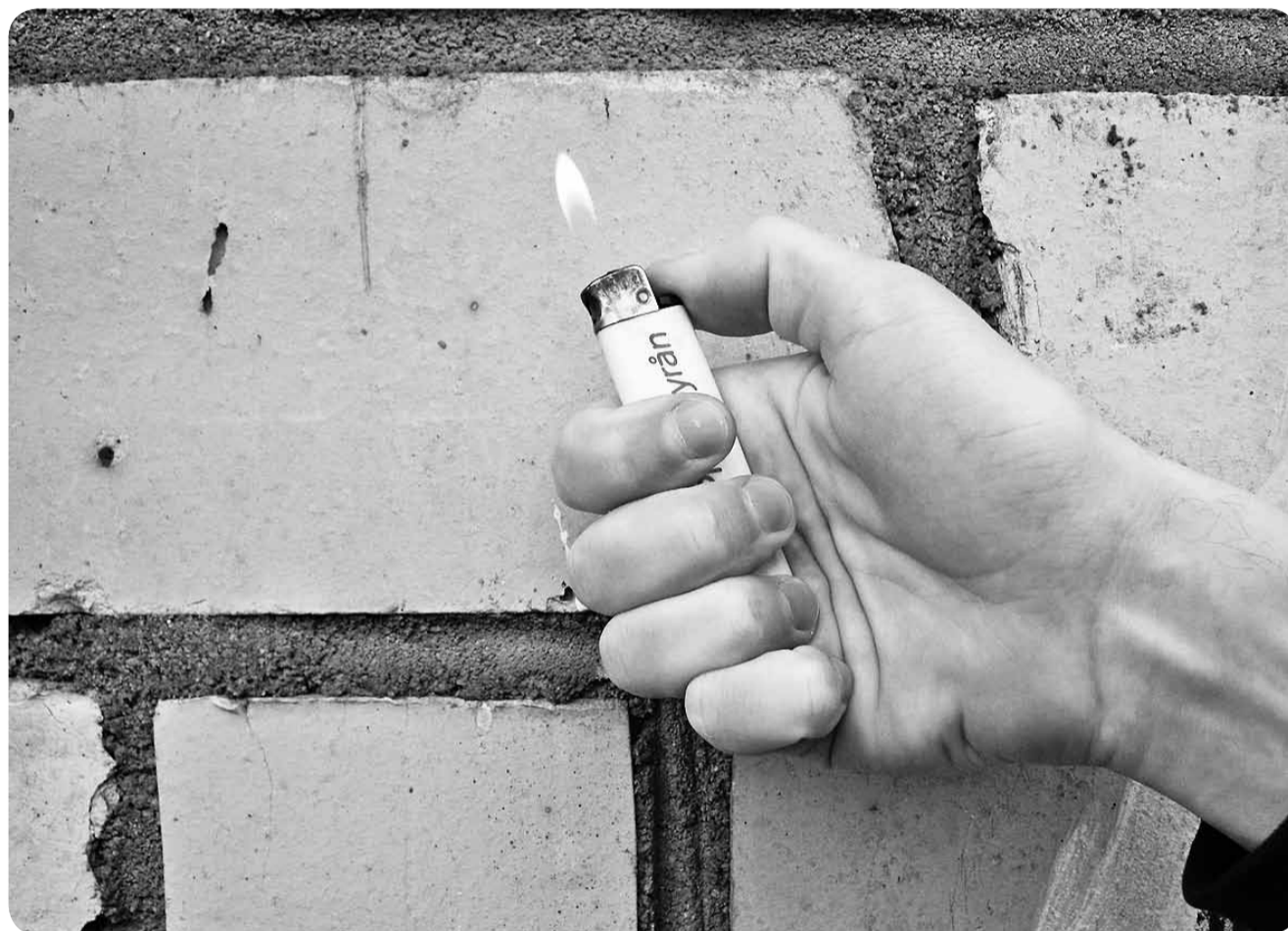
Огонь вспыхнул моментально и по следовой дорожке бензина проник внутрь гаража.

Примерно в 00 часов 40 минут 24 сентября 2013 года они подошли к гаражу, в котором ранее Игорь видел похожий автомобиль. Гараж был закрыт на на-