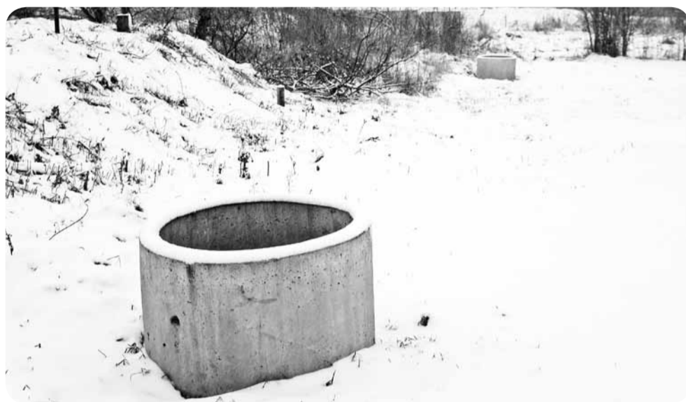
В одном из домов на этой улице бетонные кольца расставлены прямо в огороде.

Сегодня мы расскажем вам не о древнем кладе, который, вероятно, еще можно найти где-нибудь на просторах Горецкого края, и даже не о сокровищах Наполеона, которые он, возможно, "посеял" при отступлении где-то на привольных берегах Березины.