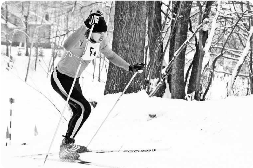
Самыми зрелищными соревнованиями спартакиады в Мстиславле были лыжные гонки.