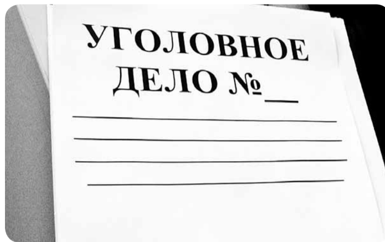
Руководство двух фирм в Горках "распилило" 200 млн рублей.