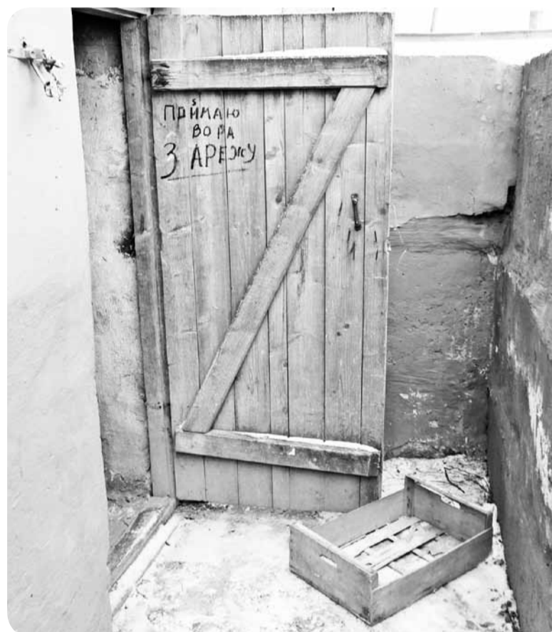
Вход в злосчастный подвал венчает "оптимистическая" надпись: "Поймаю вора – зарезу".

ная, без фонаря там делать нечего. Во-вторых, запах, почти как в бесплатном общественном туалете (по-видимому, люди, живущие здесь, насчет "справления нужды" особо не заморачиваются).