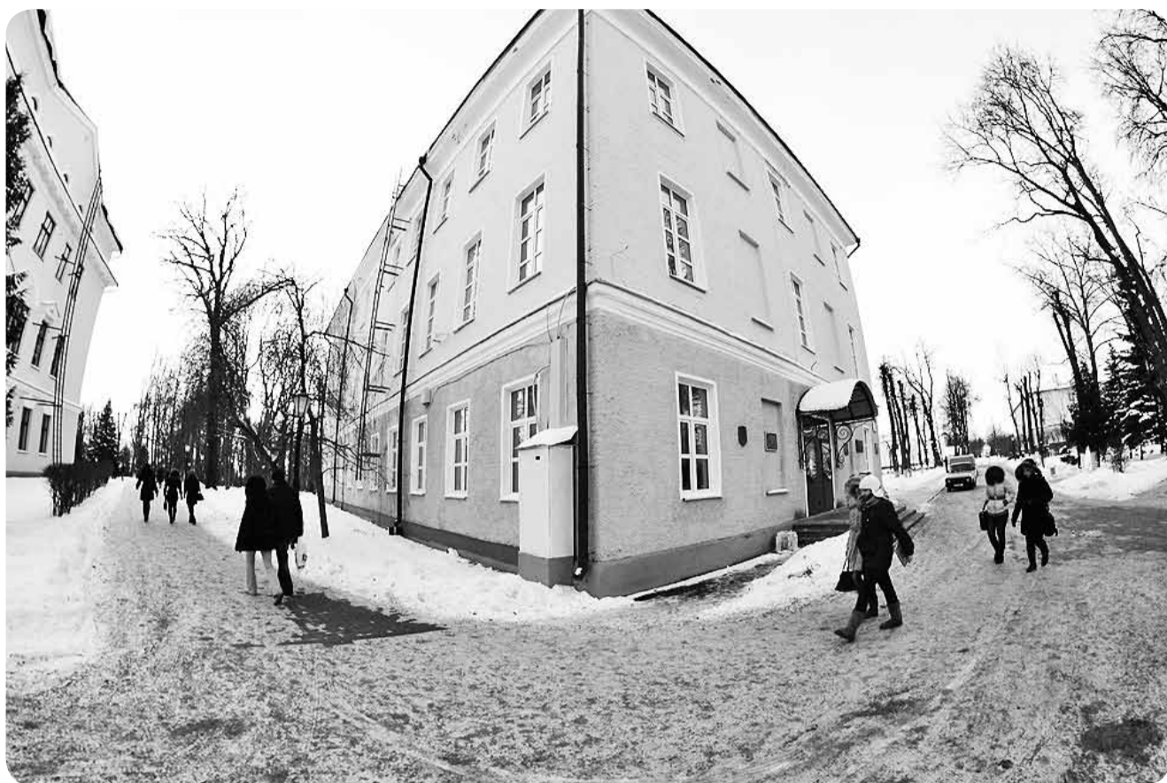
БДСГА не ўвайшла нават у 20 рэйтынга беларускіх ВНУ.

Мінадукацкі падрыхтавала рэйтынг беларускіх універсітэтаў. Горацкае ВНУ апынулася на 22 месцы з 48.