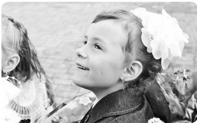
Многие идут в педагоги ради наших замечательных деток.

1 сентября тарифные ставки (оклады) учителей и педагогов дополнительного образования были повышены на 25%. Одновременно увеличилась и норма педагогической нагрузки за ставку для учителей и педагогов дополнительного