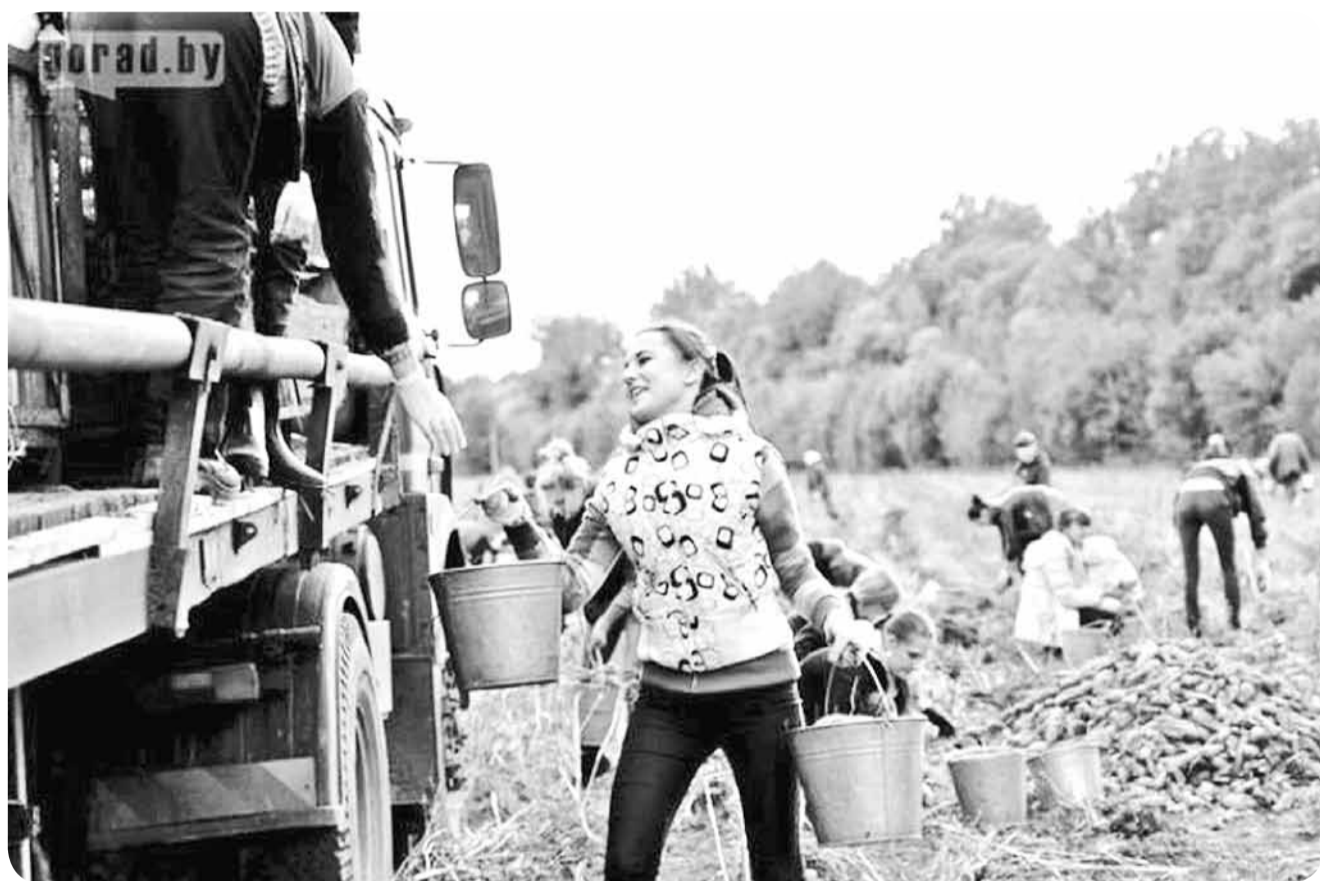
Как и в советское время, в наши дни колхозы не справляются без помощи школьников и студентов.

"За технику безопасности все расписались?" – грозно спрашивает нас