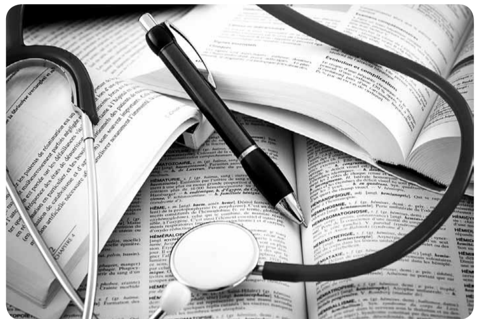
Чаго чакаць ад новага Палажэння аб парадку забеспячэння дапамогамі па часовай непрацаздольнасці і па цяжарнасці і родах?

Не кожны работнік, дый не кожны эканаміст разбярэца, як разлічваць дапамогу па непрацаздольнасці, і ніхто не пойдзе ў бухгалтэрыю запытвацца, а як жа гэта палічана ды ці правільна.