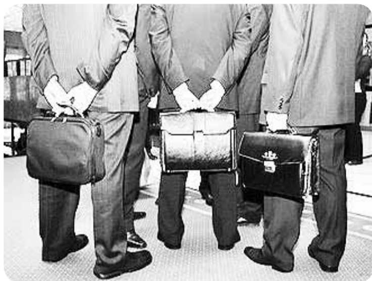
В то время как в среднем по стране зарплаты за один месяц увеличились на 5,6%, в органах государственного управления они возросли более чем на 43%.

плата работников органов госуправления увеличилась постепенно, о чем свидетельствуют данные официальной статистики. Так, в январе этот показатель составлял 4,61 млн. рублей, в феврале – 4,69 млн., марте – 4,83 млн., апреле – 5,26 млн., мае – 4,98 млн., июне – 5,3 млн. рублей.