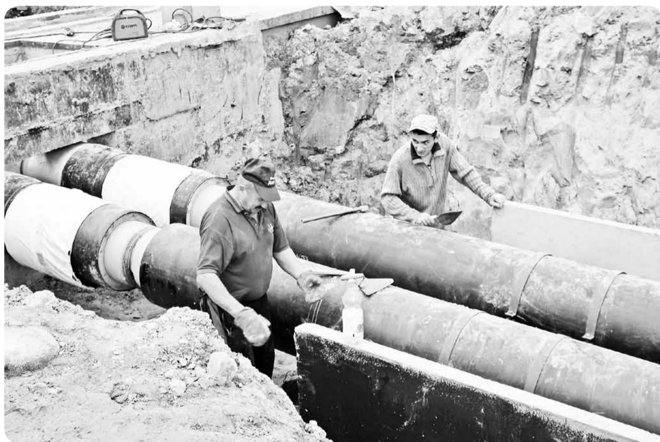
На новой котельной на территории Академгородка идет укладка теплосетей.

Новая котельная будет выполнять ту же самую функцию, что и нынешняя – отопление и горячее водоснабжение этого городского района. Но не только. В проекте предусмотрена установка мини-ТЭЦ (газо-поршневого агрегата) электрической мощностью 1 мегаватт. (Аналогичная установлена на центральной городской котельной). Это позволит производить электроэнергию для внутренних нужд котельной, а некоторая часть энергии