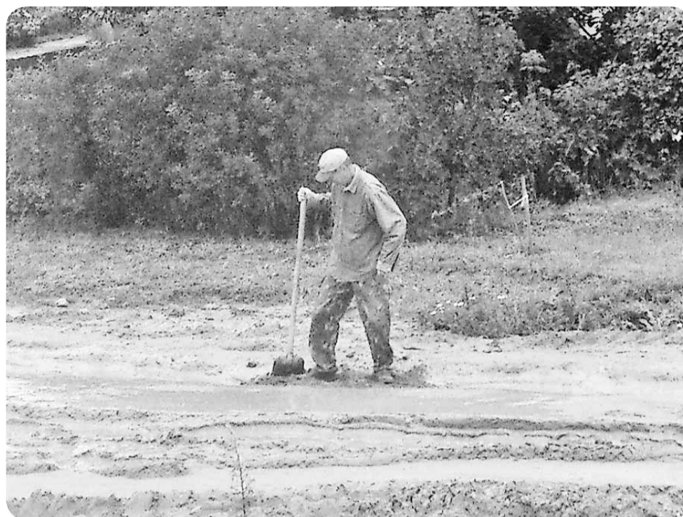
Люди своими силами пытаются сделать дорогу пригодной для передвижения.

О проблемах улицы Северной, которая находится в коттеджном поселке академического городка, мы уже писали весной 2012. К сожалению, за истекшие почти полтора года работники "Прометей" так и не выполнили своих обещаний – жители улицы по-прежнему утопают в грязи.