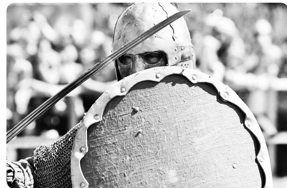
Старинный Мстиславль привлекает не только реконструкторов из рыцарских клубов, но и "черных копателей".

Кроме шлема в хорошем состоянии оказался стальной панцирь с поддоспешником из кожи буйвола и латунными накладками, перчатки, подлокотники, кольчуга. Кстати, под ней специалисты обнаружили элементы льняной и кожаной одежды.