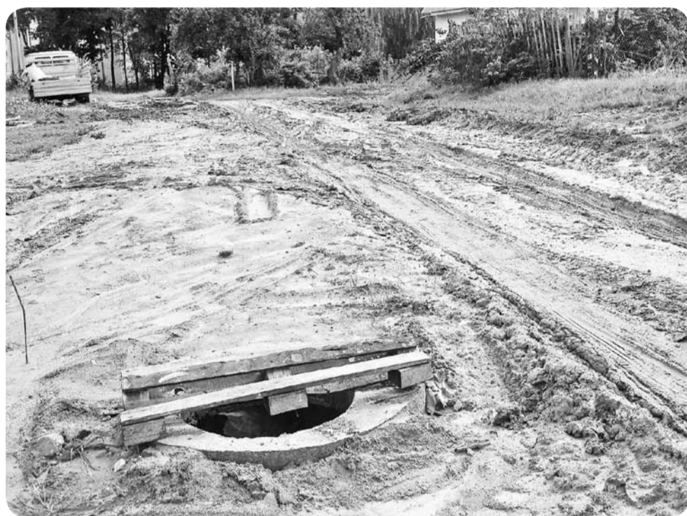
Начатая несколько лет канализация пока не готова.