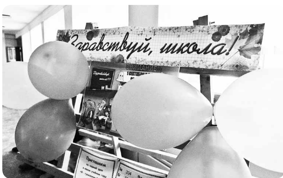
Что готовит нам новый учебный год?